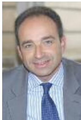
JEAN-FRANÇOIS COPÉ Président de la Communauté d'Agglomération du Pays de Meaux

La Lettre du Pays de Meaux ou encore le site Internet de la CAPM ( www.agglo-paysdemeaux.fr ) ou le site de la mairie de Villenoy ( www.mairie-villenoy.fr ) permettront de faire régulièrement le point sur l'avancée des travaux du PAMP. Avec les élus de l'Agglomération, nous souhaitons vous associer à chaque étape des aménagements en vous informant des étapes franchies et des ouvrages réalisés. En créant le PAMP, nous sommes fiers de proposer l'un des projets de développement économique les plus importants en France. Il est la preuve que nous continuons à nous démener sans relâche afin d'offrir aux habitants de nos 18 communes les emplois nécessaires à une belle qualité de vie.